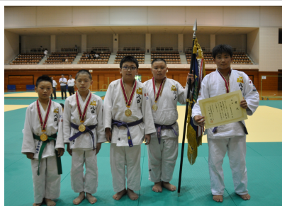
↑団体2連覇・八戸市柔道少年団