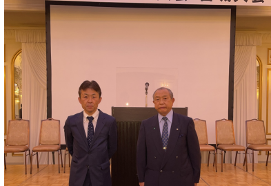
第40回 東北学術大会 宮城大会

参加・聴講された先生方につきましては、県民の健康維持・向上への貢献、そして柔道整復学の発展に努めるべく、ぜひ今回得た知識や技術を日常業務に反映しながら各地域に還元して頂きますよう宜しくお願い致します。